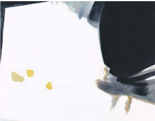
猪瀬文子 春 162.1 × 162.1