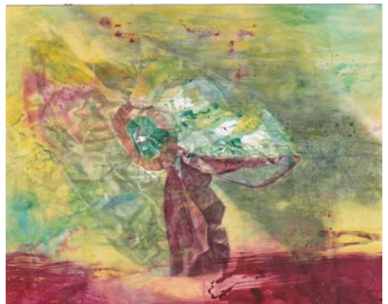
渡邊素子 紙風船 130.3 × 162.1