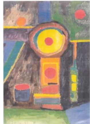
山内哲夫 静物 90.9 × 72.7