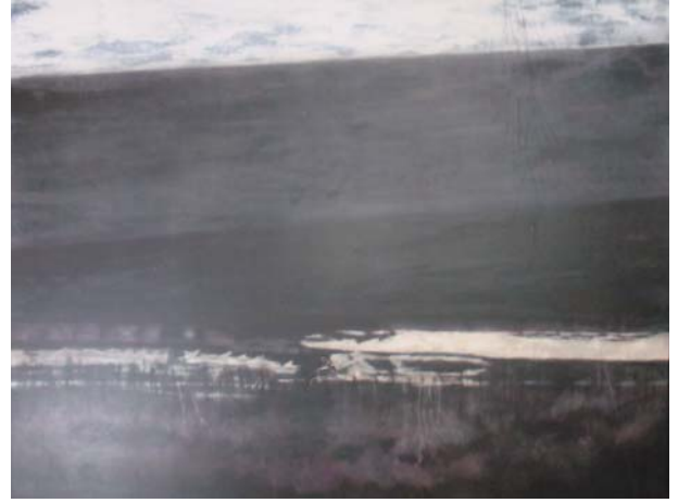
小林正美 厳冬山湖 112.1 × 145.5