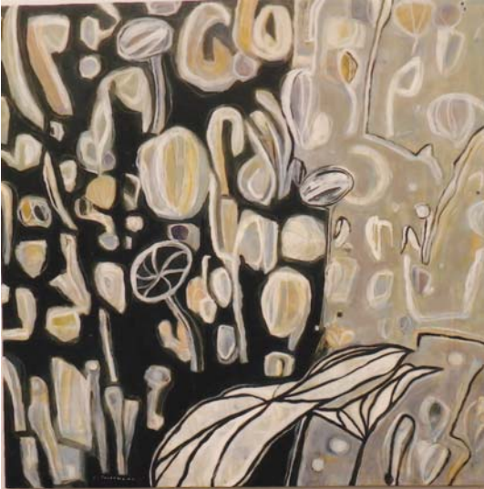
小笠原 緑 月あかりの水辺 162 × 162