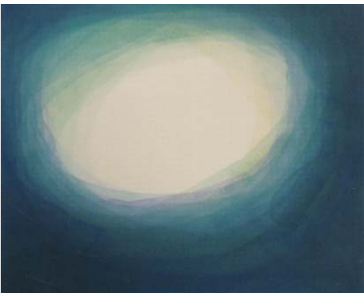
古浦祐子 時のかなたへ 65.2 × 80.3