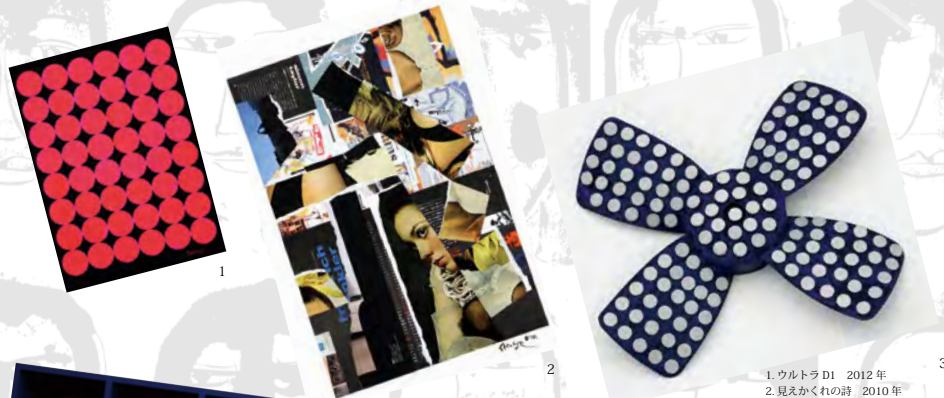
1. ウルトラD1 2012年 2. 見えかくれの詩 2010年 3. ウルトラの花A 2012年 4. 悟り 2010年 5. 私は貝になりました 1993年