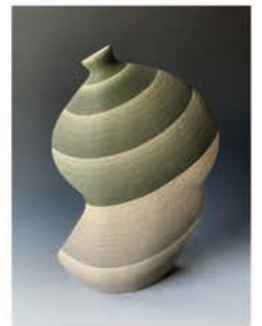
ルミ W.パウマン (陶芸)