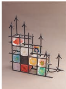
寺西 真紀子 (ガラス)