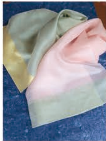
湯本 左緒里 (染織)